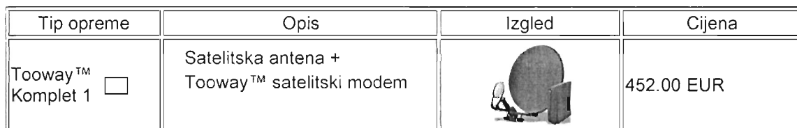
Tabela »Tooway™ korisnička oprema«

1.4. Korisnik ima pravo na promjenu izabranog Tooway™ paketa na način: Korisnik ima pravo, na promjenu izabranog Tooway™ paketa na paket manjeg ili većeg kapaciteta u odnosu na ugovoreni. Od trenutka promjene paketa Korisniku će se obračunavati cijena servisa shodno novoizabranom paketu.